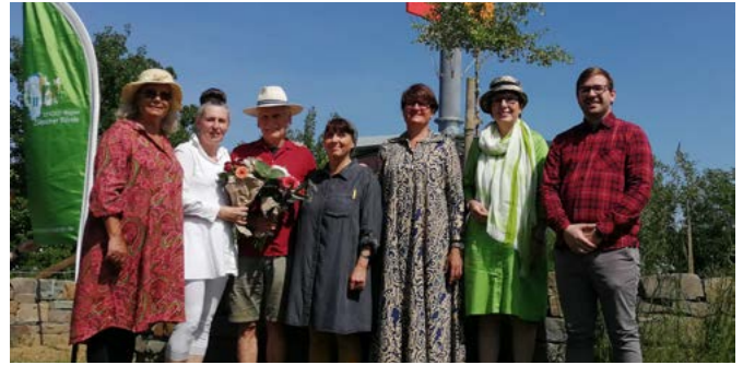
Bei strahlendem Sonnenschein waren alle beteiligten Akteure erfreut über die Fertigstellung des Kunstexponates.

Weitere Informationen zum Projekt erhalten Sie unter http://www.heart-kunstprojekt.com