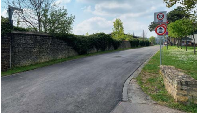
Auf der Langendorfer Straße in Bürvenich wurde der Teilbereich entlang der Stephanusschule/Turnhalle erneuert.

Im Fall der Bahnhofstraße in Dürscheven wurde eine Erneuerung der Fahrbahndecke auf voller Länge vorgenommen. Auf der Langendorfer Straße im Ortsteil Bürvenich wurde der Teilbereich entlang der Stephanusschule/Turnhalle erneuert. Mit diesen Erneuerungsmaßnahmen wurde der Zustand beider Straßen zumindest für die nächsten 12 bis 15 Jahre erheblich verbessert. Der Standard einer Ausbaumaßnahme im beitragsrechtlichen Sinne wurde jedoch mit dieser Lösung nicht erreicht. Möglich wurden diese Maßnahmen, da die Verwaltung für die insgesamt rund 150.000 Euro teuren Fahrbahnerneuerungen Fördermittel aus dem Sonderprogramm „Erhaltungsinvestitionen kommunale Infrastruktur Straßen und Radwege“ des Landes NRW generieren konnte.