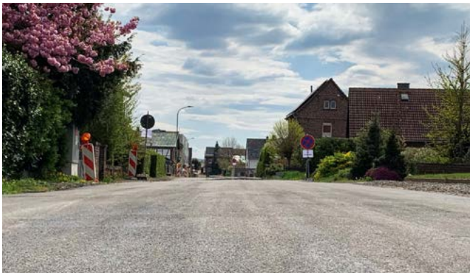
Im Fall der Bahnhofstraße in Dürscheven wurde eine Erneuerung der Fahrbahndecke auf voller Länge vorgenommen.